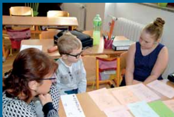
Ze zápisu do první třídy.