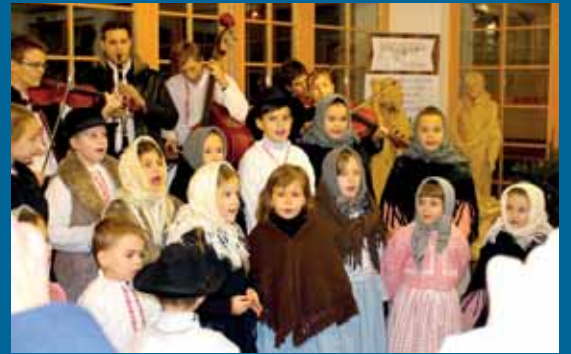
Polešovjánek na otevírání Slovácké tržnice v Uherském Hradišti