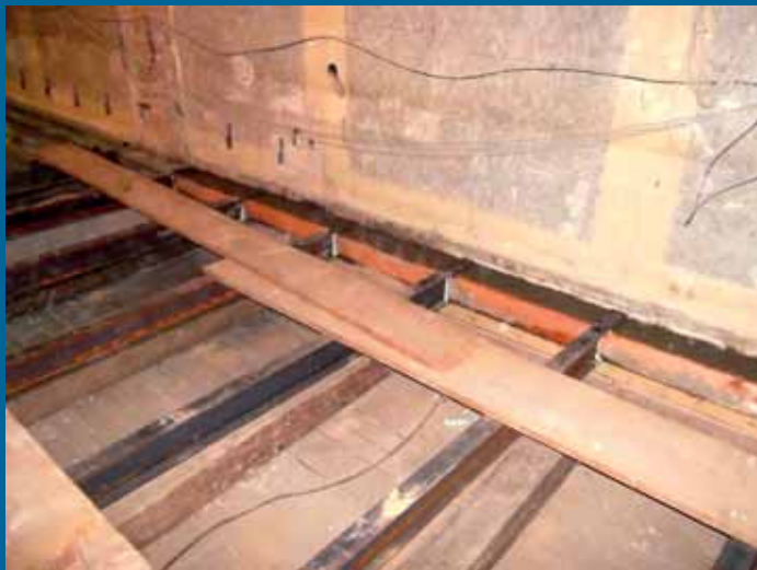
Rekonstrukce obřadní místnosti úřadu