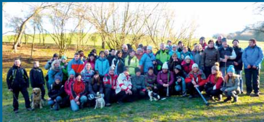
Výšlap „Zkratkou na Floriánku“