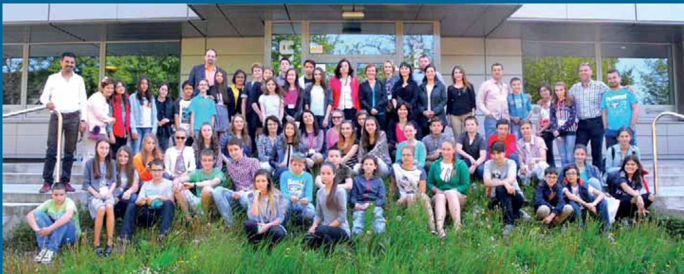
Účastníci setkání projektu eMM.tif