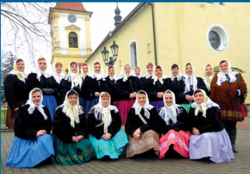
Drmolice ve Vracově