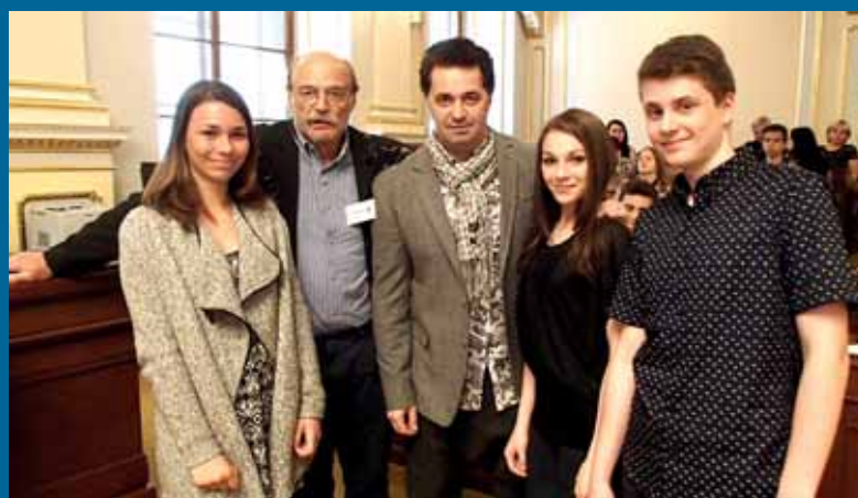
Slavnost předání ocenění v soutěži Světlo na cestu.