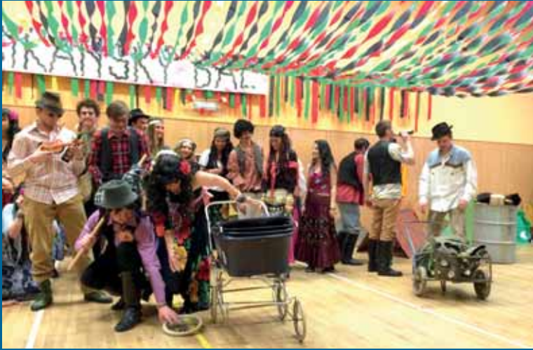
Šibřinky po cikánsku