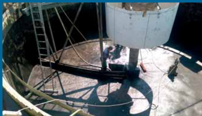
Oprava čistírny odpadních vod