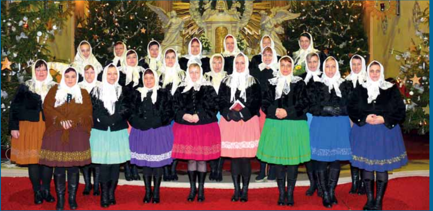
Drmolice po Vánočním koncertu v kostele