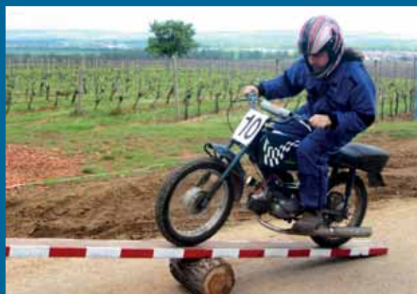
Fechtl cup Floriánka