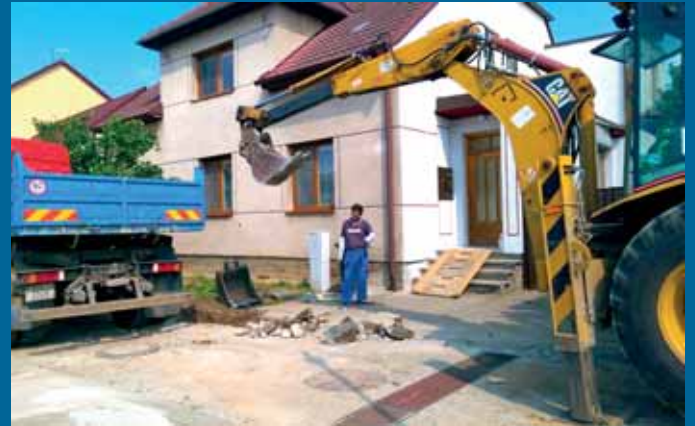
Výkopové práce v Míškách