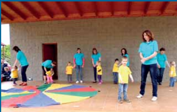
Jednota Staré Město