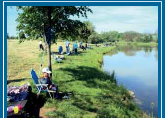
Dětské rybářské závody