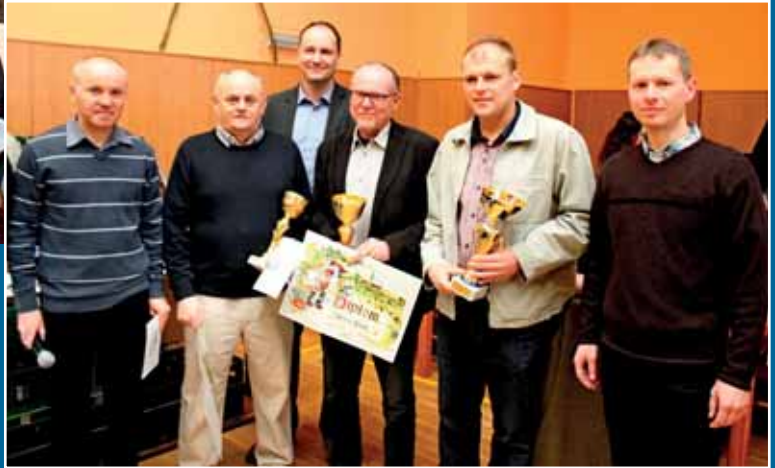
Velikonoční košt vína na sokolovně