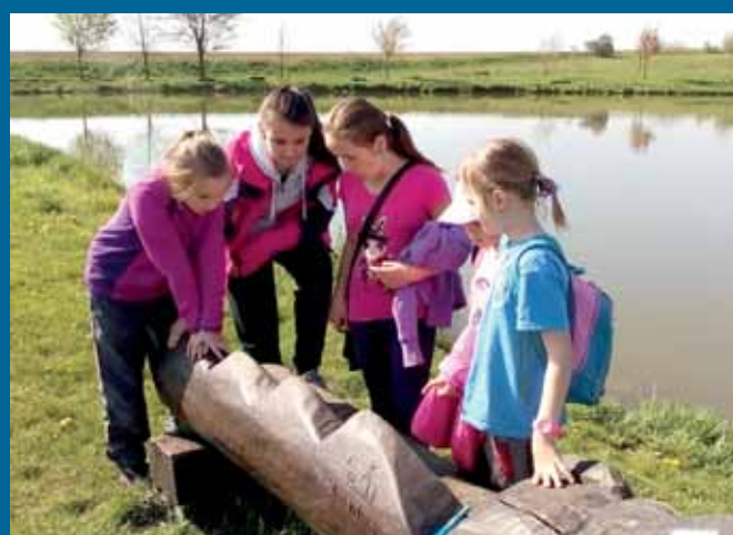
Den Země 2015 u rybníka pod školou.