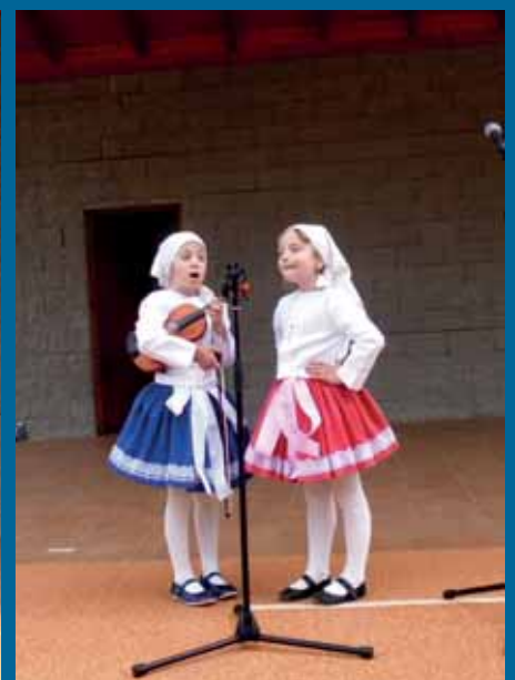
Děvčata z Domanína