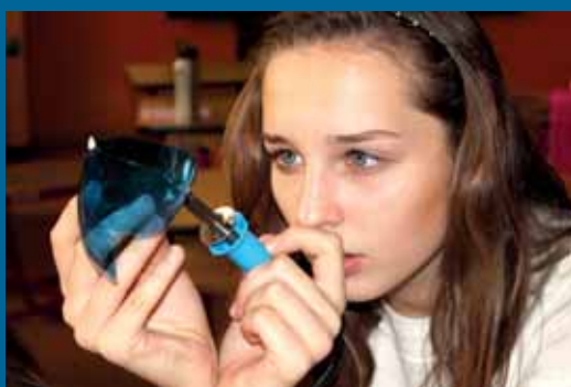
Výroba plastových šperků projekt 57.