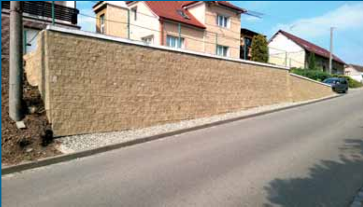
Obklad zdi Na Zábraní