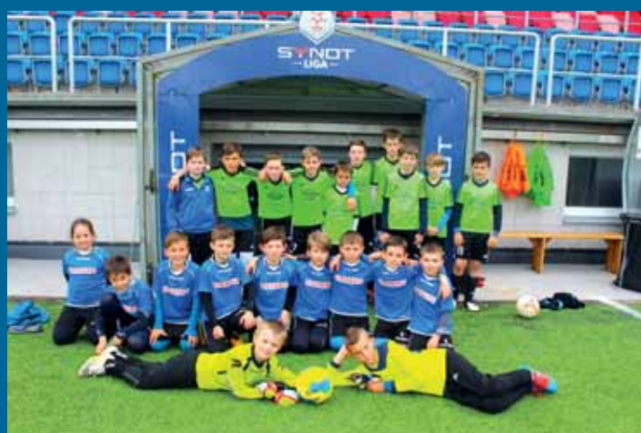
Úspěšní fotbalisté z 1. stupně.