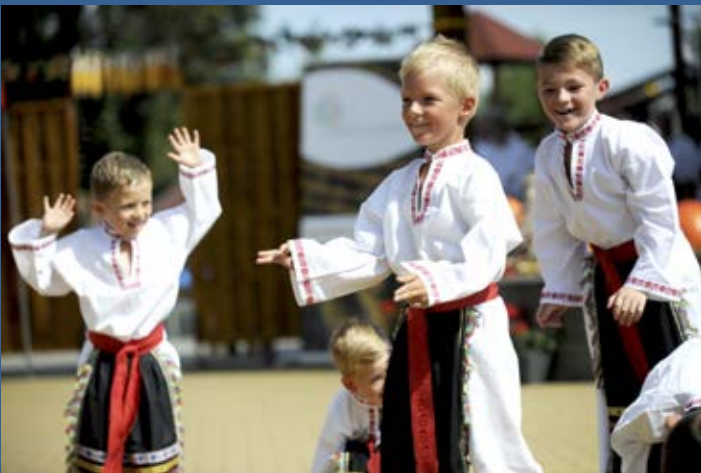
Děti z MŠ na Vinařských slavnostech