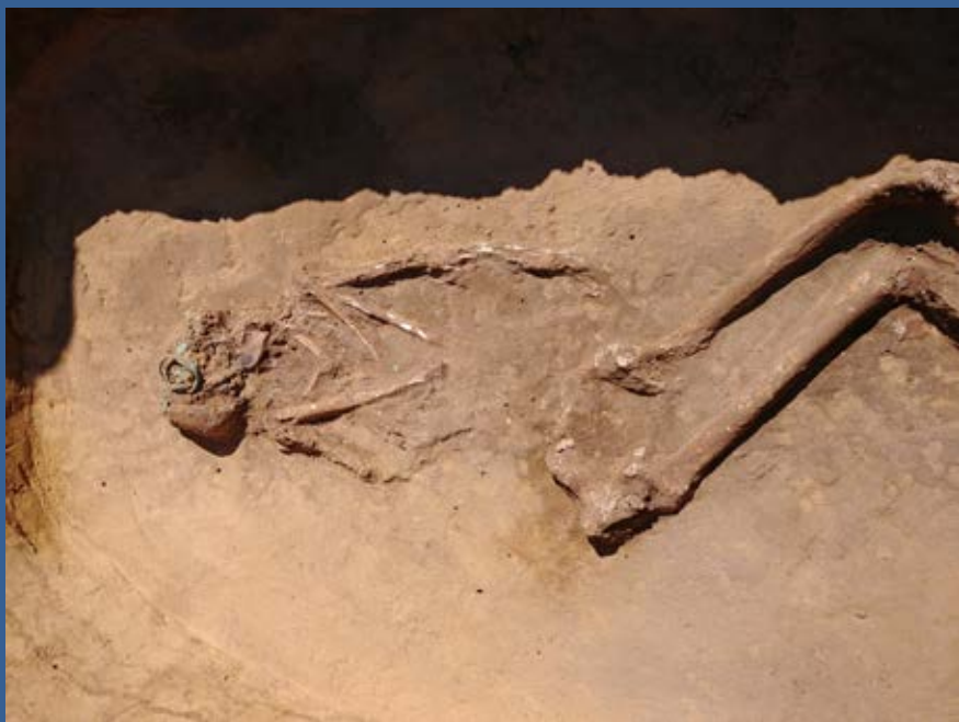
Nové nálezy na pískovně