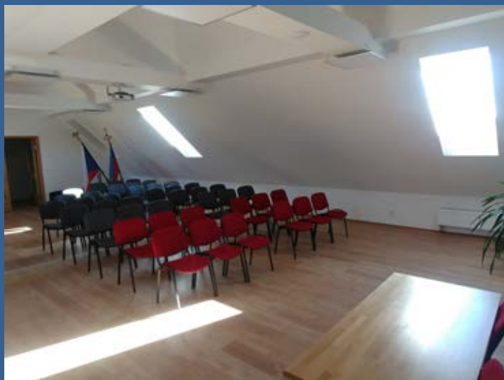
Rekonstrukce střechy a podkroví úřadu městyse