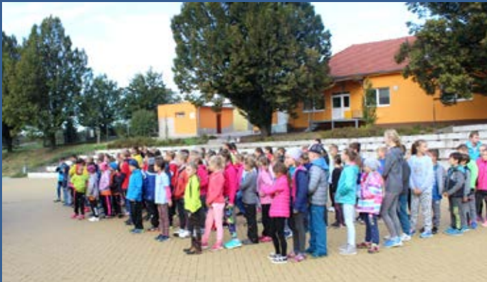
Účastníci atletického čtyřboje