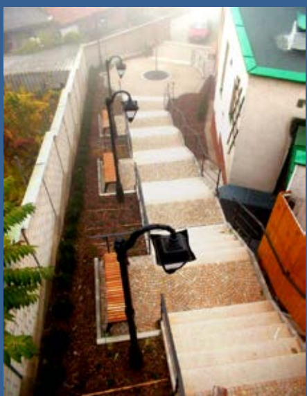
Pohled na schodiště ke kostelu