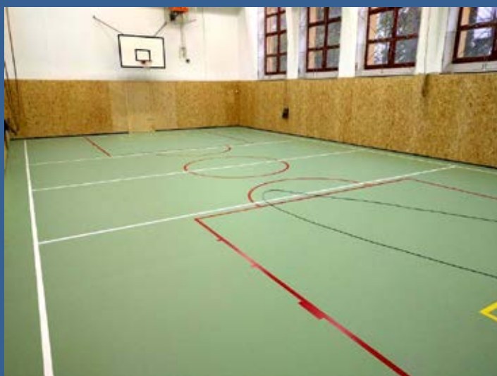
Nová podlaha a obklad stěn v tělocvičně ZŠ