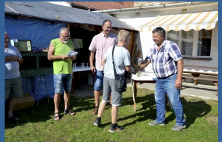
Předání ceny mladému chovateli