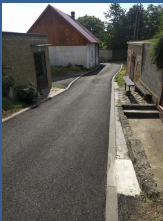
Nová komunikace na Zbořisku