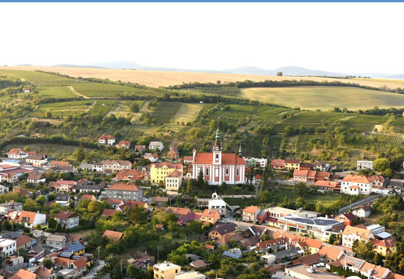
Letecký pohled na střed Polešovic

Polešovice / č. 2 / říjen 2018 / CENA 20,- Kč