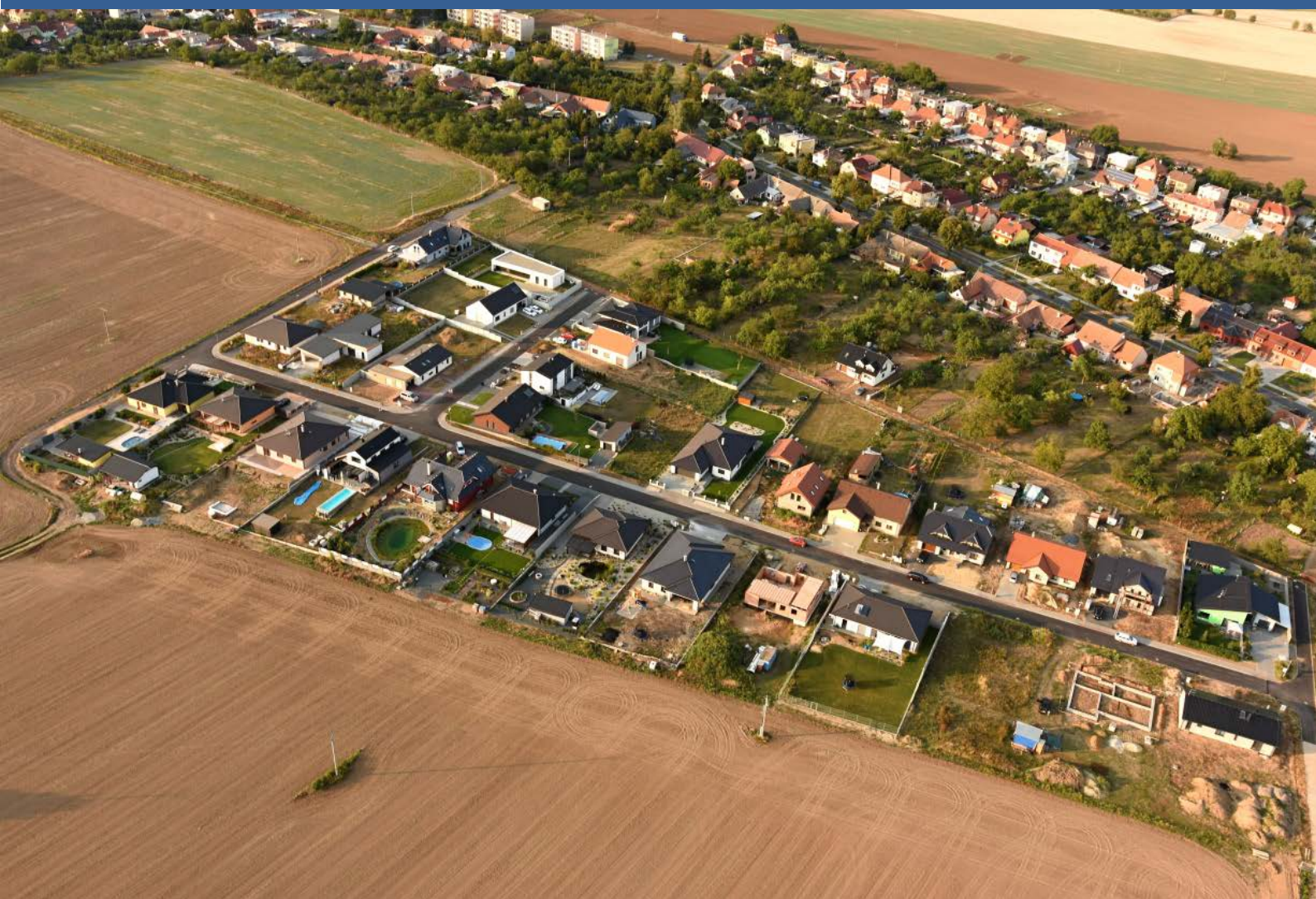
Nová čtvrť Díly s novou komunikací