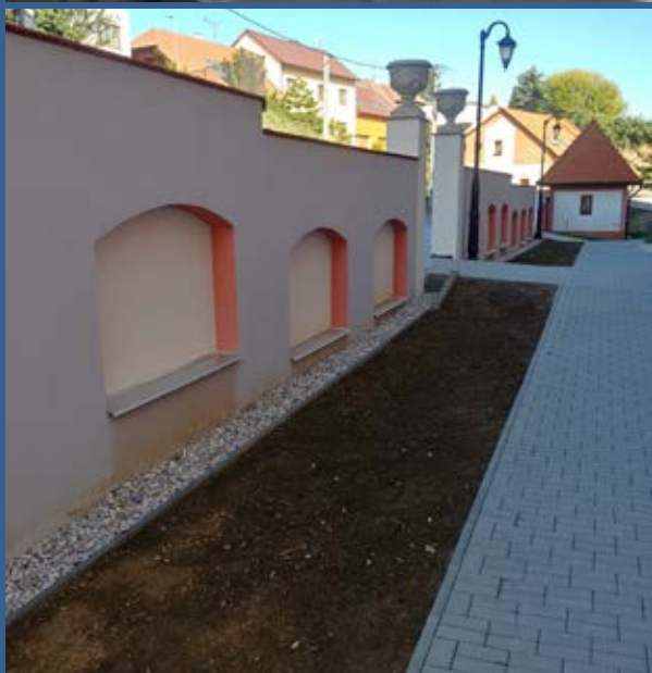
Oprava zdi a vstupní brány u kostela