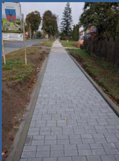
Rekonstrukce chodníků na Salajce