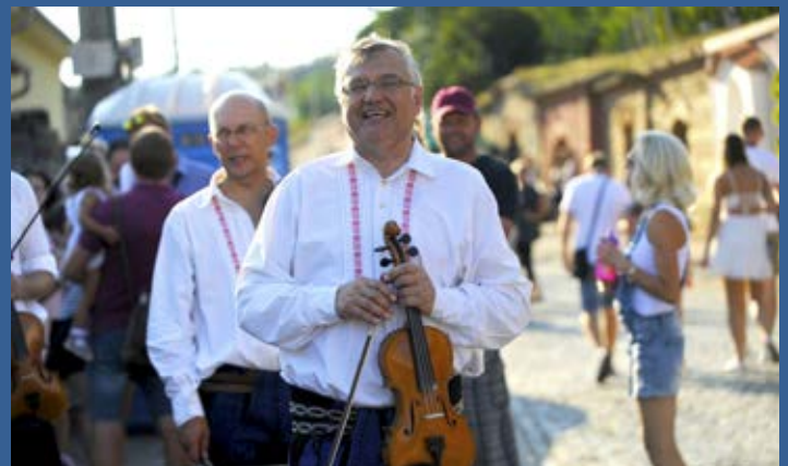
Cimbálová muzika Kunovjan na Vinařské ulici