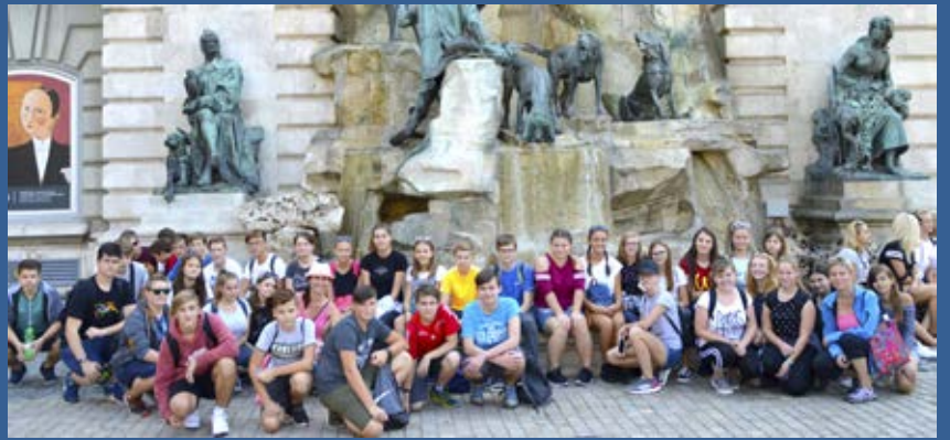
Osmáci v Budapešti