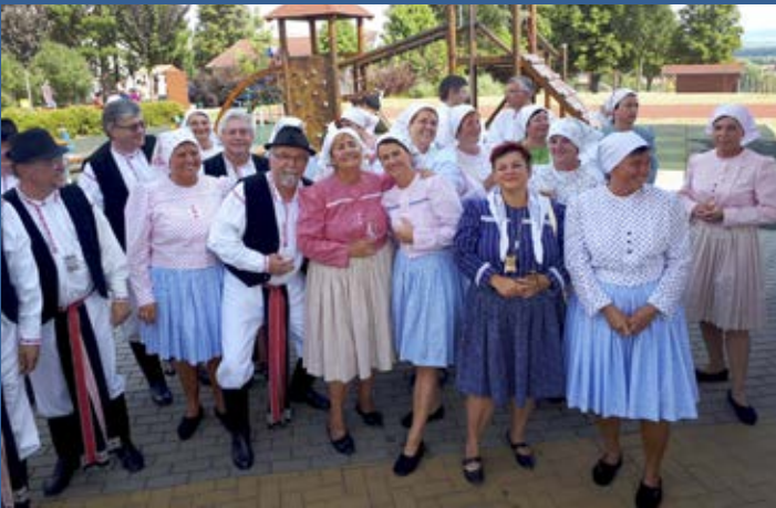
Drmolice a Chlapi z Kunovic