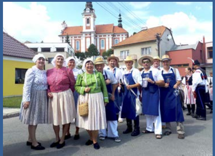
Drmolice a polešovští vinaři