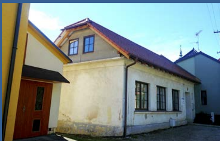
Rekonstrukce střechy skautské klubovny