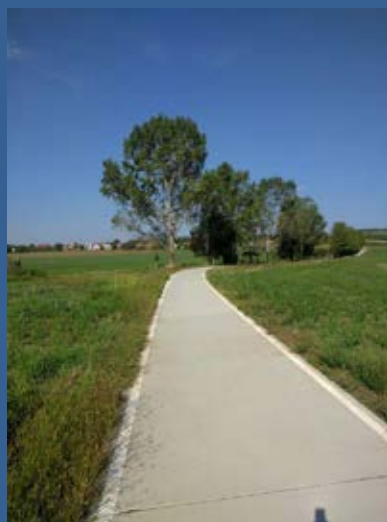
Cyklostezka Polešovice - Nedakonice