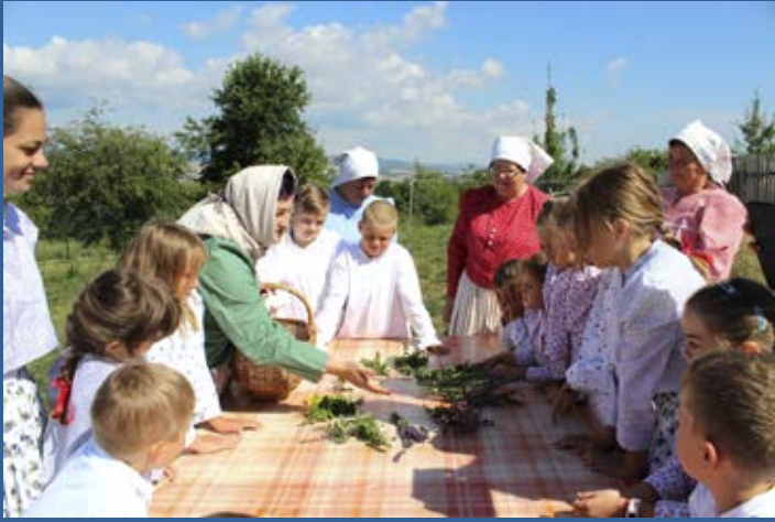
Drmolice v Parku Rochus