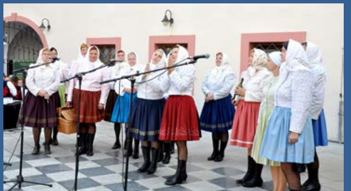
Vystoupení Drmolice na Slavnostech vína