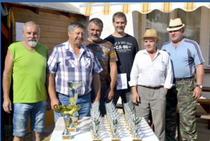
Organizační tým s cenami