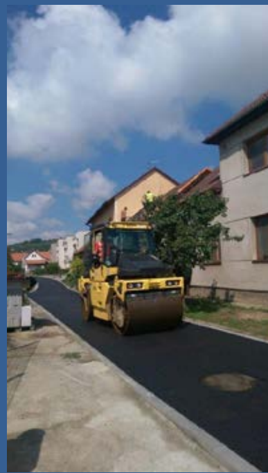
Výbudování asfaltové cesty na Suchém řádku