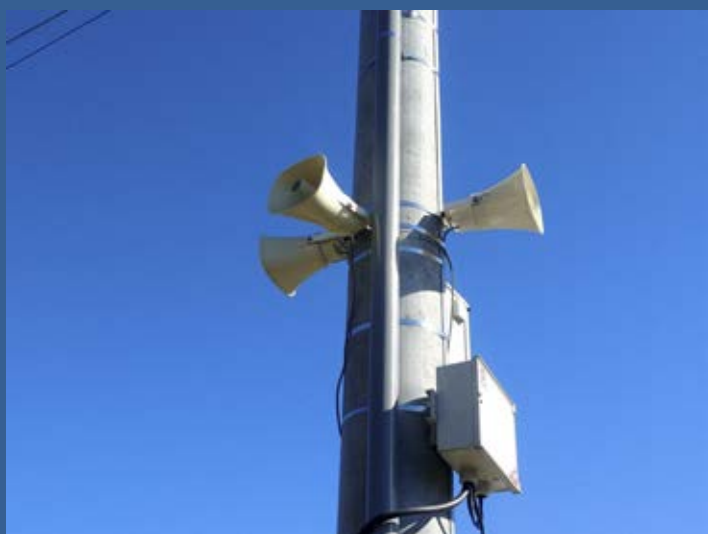
Výměna bezdrátových hlásičů