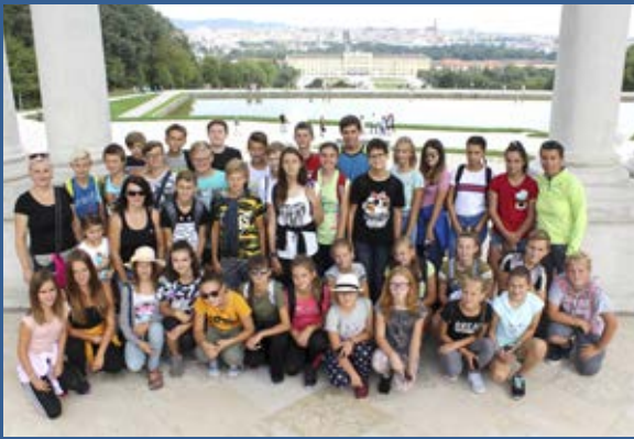
Šedáci ve Vídni