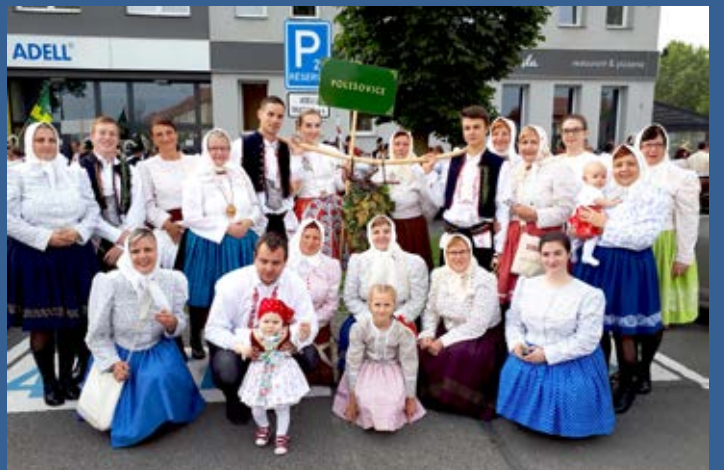
Krojování na Slavnostech vína v Uherském Hradišti