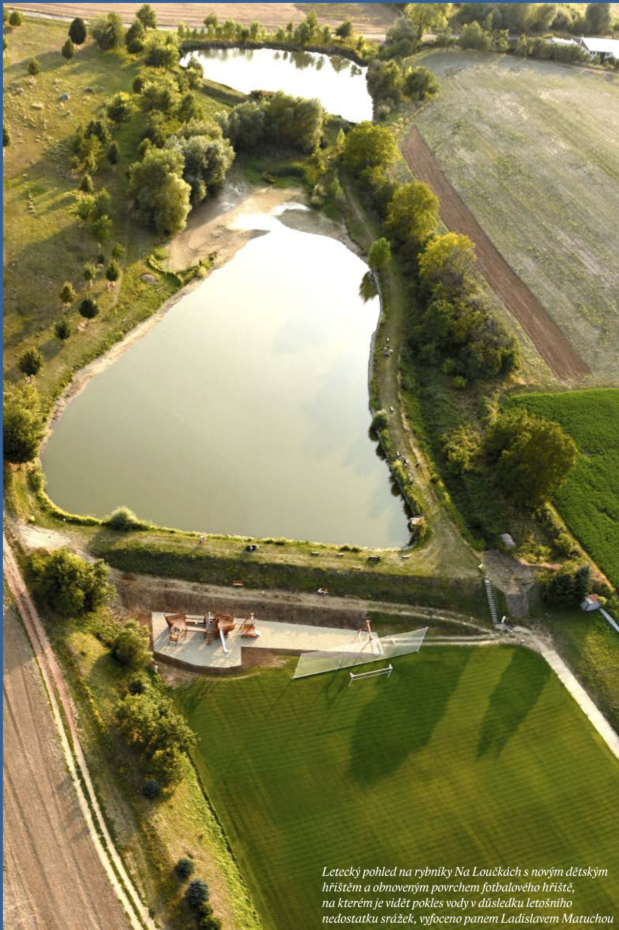
Letecký pohled na rybníky Na Loučkách s novým dětským hřištěm a obnoveným povrchem fotbalového hřiště, na kterém je vidět pokles vody v důsledku letošního nedostatku srážek