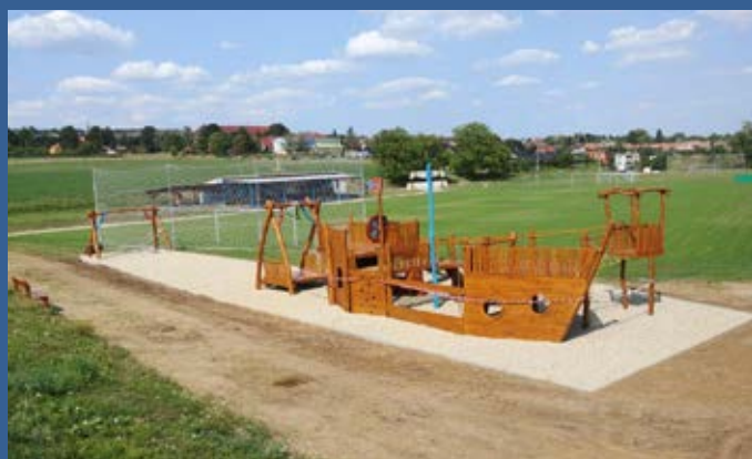
Výstavba dětského hřiště pod rybníkem