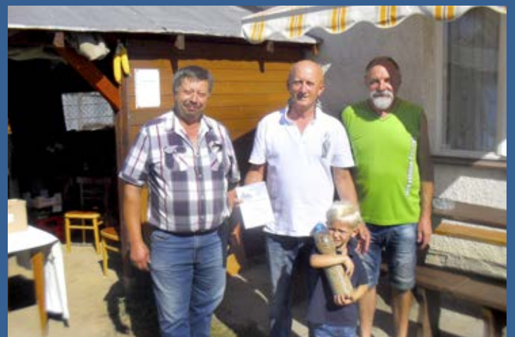
Výstavy se zúčastnil i senátor Ivo Valenta