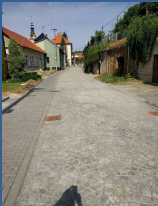
Rekonstrukce ulice Vinařská