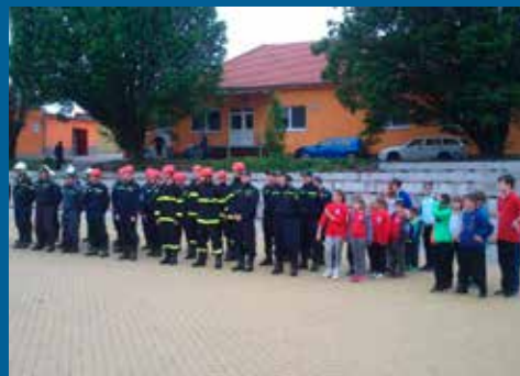
20. 5. 2017 pořádali hasiči okrskovou soutěž v požárním sportu na školním hřišti