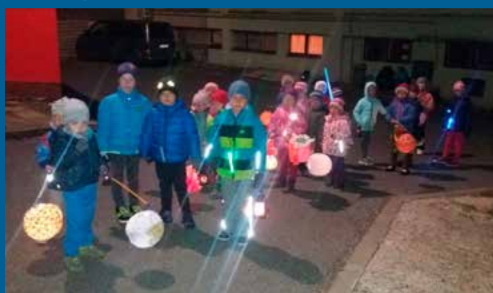
lampiónová výprava za pokladem