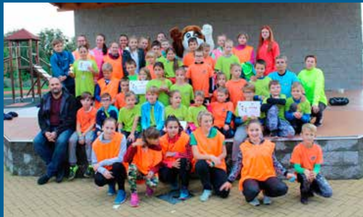
reprezentace školy na tradičním atletickém čtyřboji - 22. 9. 2017