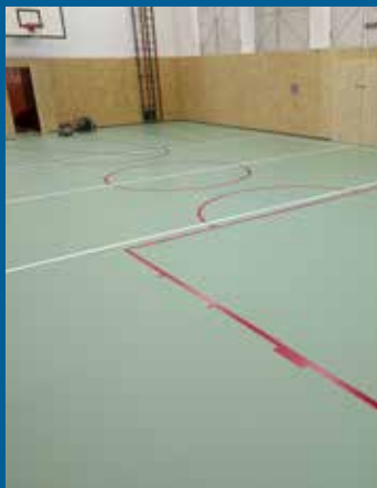
rekonstrukce podlah a obložení stěn v ZŠ Polešovice