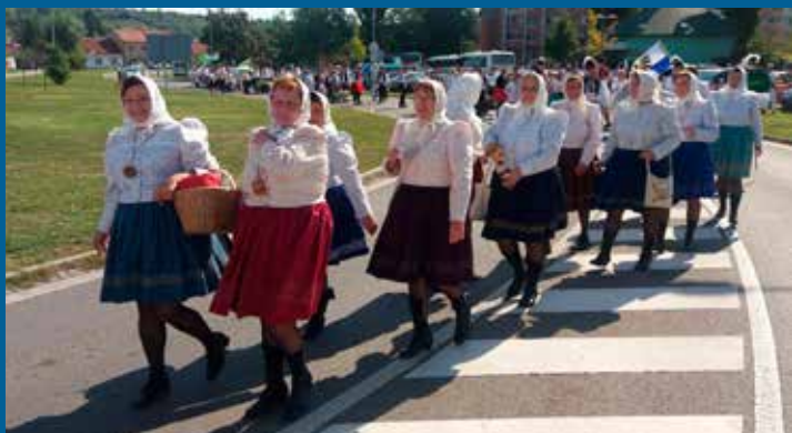
Drmolice v průvodu na Slavnostech vína v Uherském Hradišti