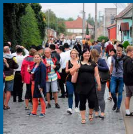
a na Vinařské ulici vyvrcholilo