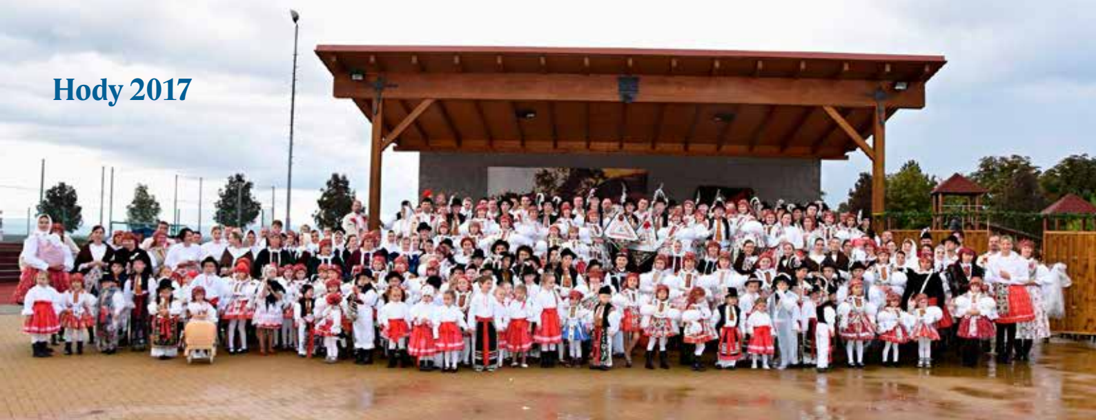
společné foto všech krojovaných