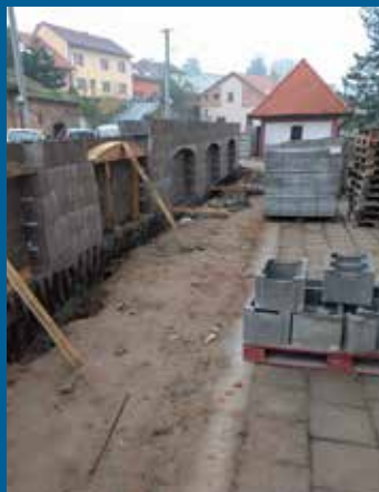
oprava kostelní zdi