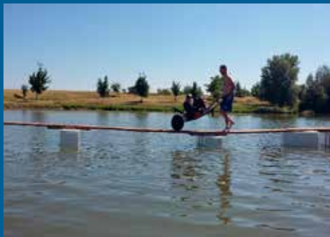
24. 6. 2017 pořádali hasiči 3. ročník lávky