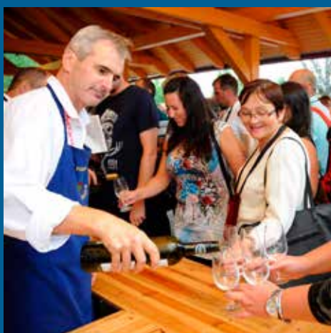
ve vinném stanu to pokračovalo