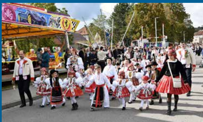
v čele průvody šly děti z mateřské školy