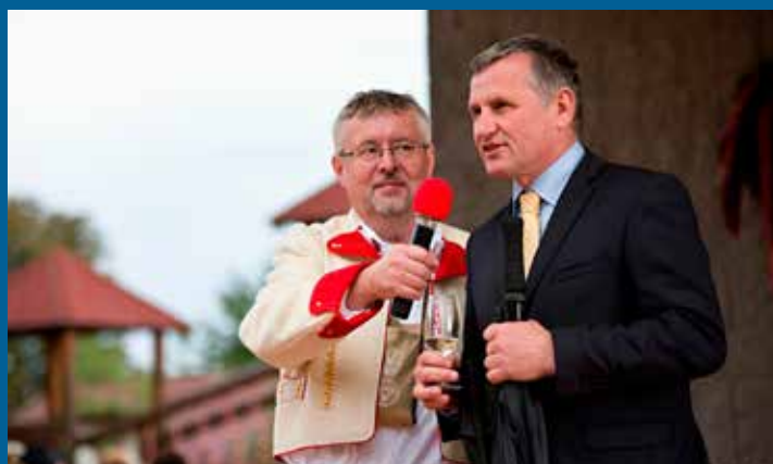
i na hody nás přijel pozdravit hejtman Zlínského kraje pan Jiří Čunek