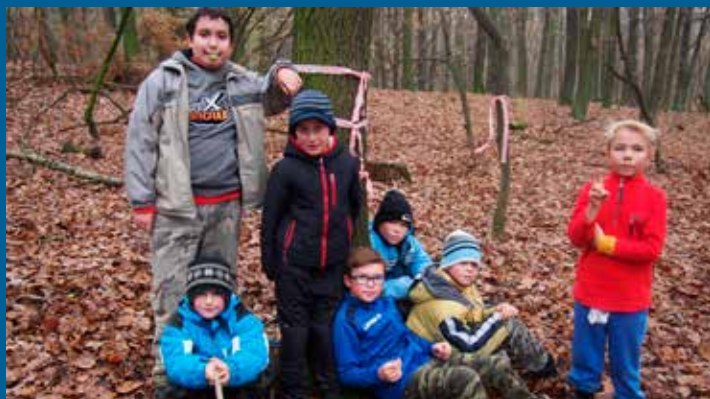
vlčata v Divoku