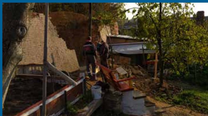
oprava opěrné zdi pod DPS