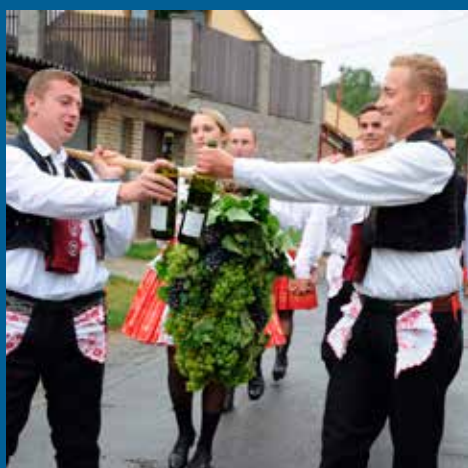
v průvodu bylo veselo