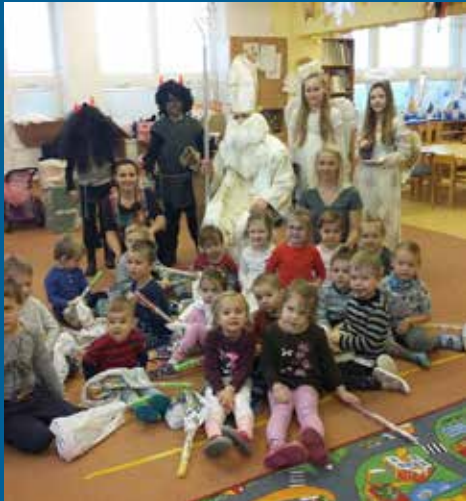
návštěva sv. Mikuláše s družinou v oddělení Sluníček