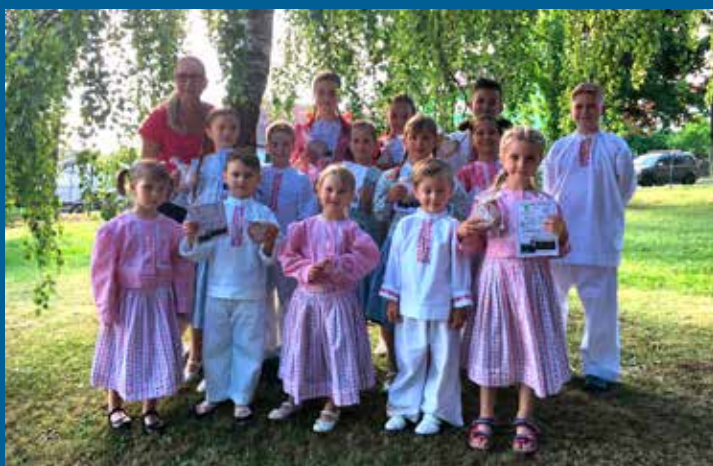
folklorní festiválek Osvětimany