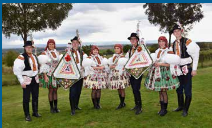
stárci, stárkyně a jejich pomocníci