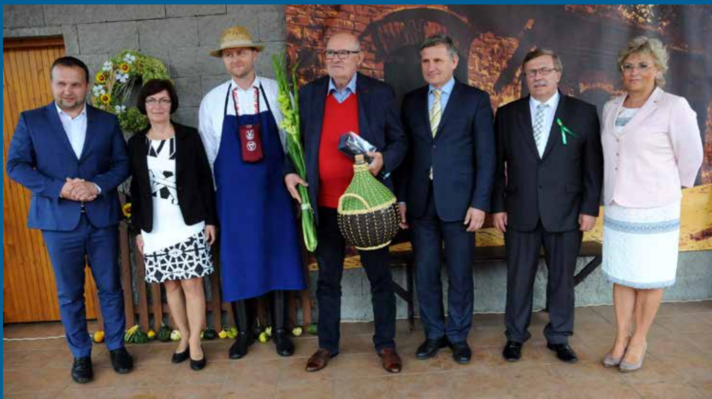
Ing. Marian Jurečka, Ing. Dagmar Gracová, Mgr. Zbyněk Vačura, Ing. Jaroslav Vačura, hejtman Jiří Čunek, Ing. Zdeněk Jandejsek, Margita Balaščíková