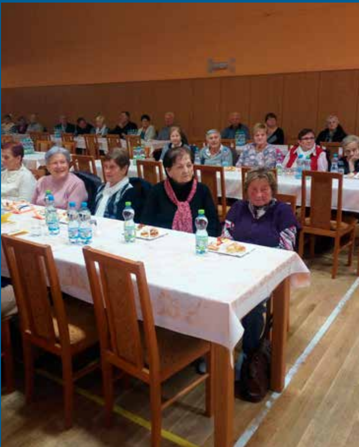
beseda se seniory v sále sokolovny 23. 11. 2017