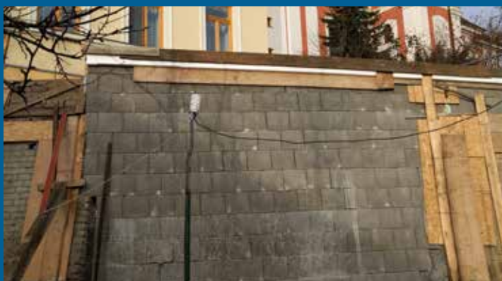
oprava opěrné zdi pod DPS