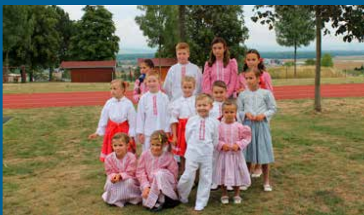
Polešovjánek na vyhlášení TOP Víno Slovácka 2017