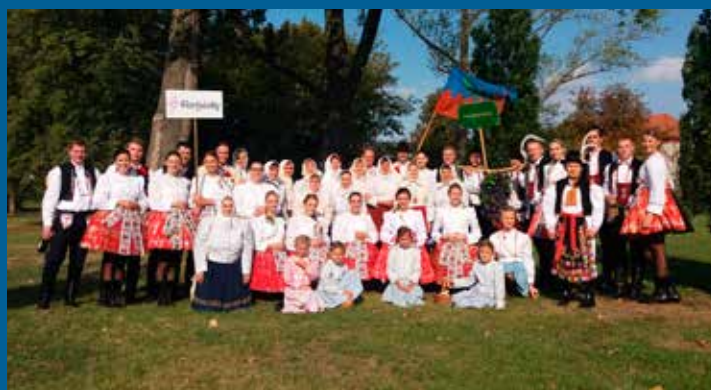
polešovická výprava na Slavnostech vína v UH