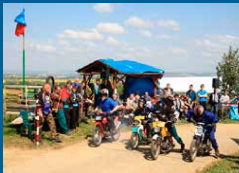
hasiči se podíleli na organizaci FECHTL CUP Floriánka 6. 5. 2017