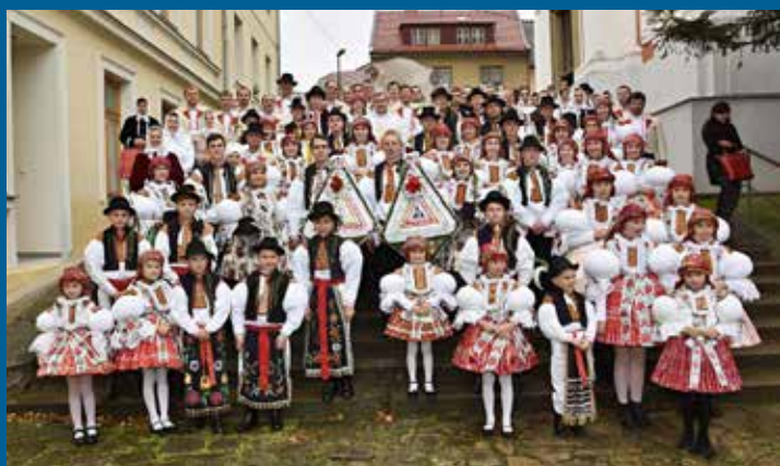
účastníci nedělní mše svaté před kostelem