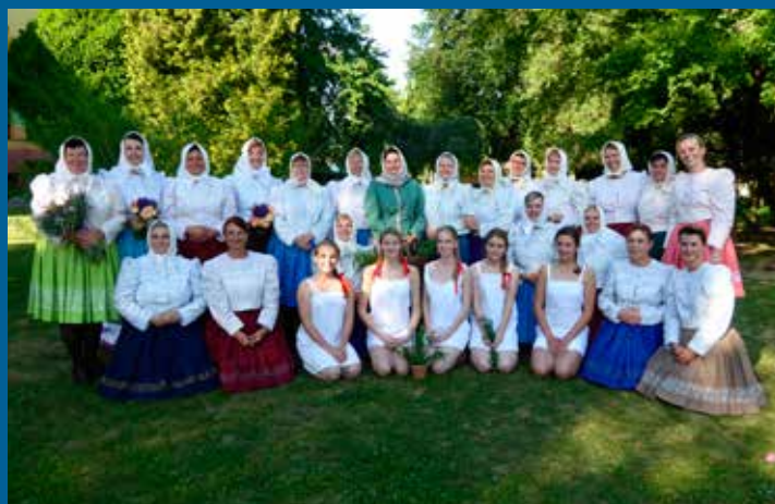
hlavní aktérky Svatojánského čarování