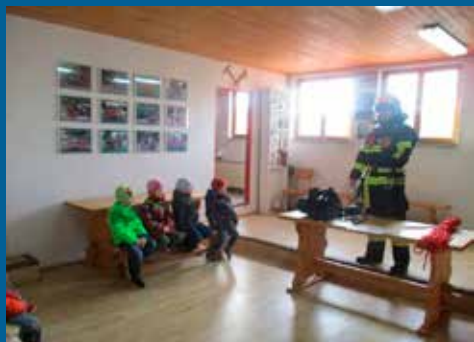
exkurze žáčků MŠ v hasičárně 16. 3. 2017