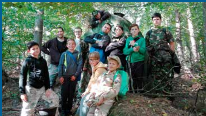
skauti na výpravě v Osvětimanech