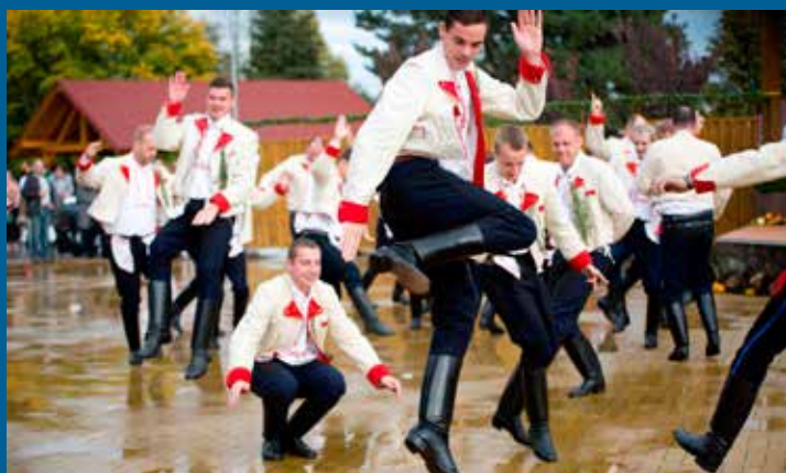
verbuňk v podání lajblístů