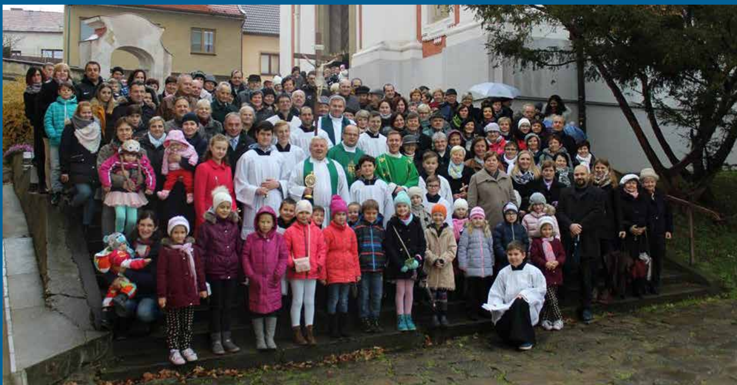
účastníci misijní mše svaté s misionáři v neděli 19. listopadu