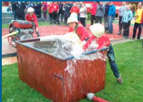
okrskové soutěže se poprvé letos zúčastnili i dětské družstva z Kostelan, Tučap a Nedakoníc