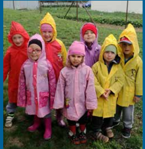
podzim ve školce