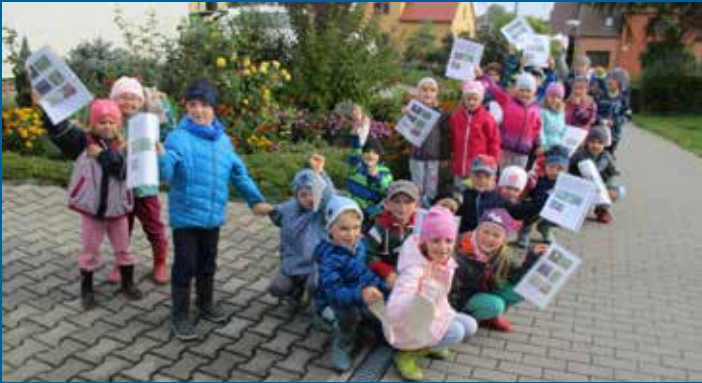
studium bylinek - oddělení Žabičky