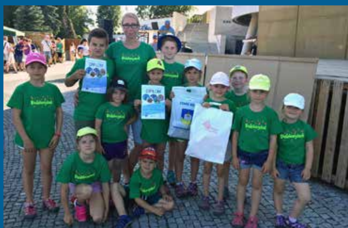
folklorolympiáda ve Starém Městě