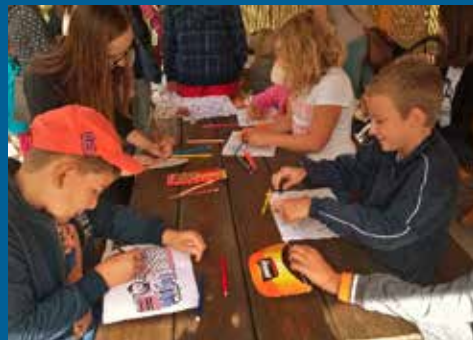
2. 9. 2017 hasiči uspořádali tradiční ukončení prázdnin pro děti se spoustou stanovišť a disciplín