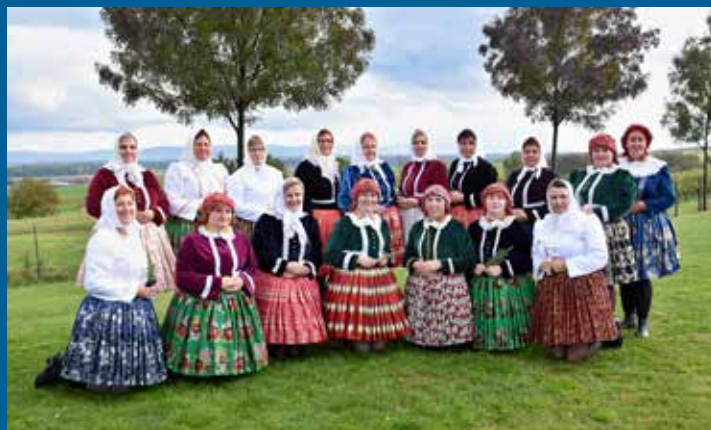
ani Drmolice nesměly chybět