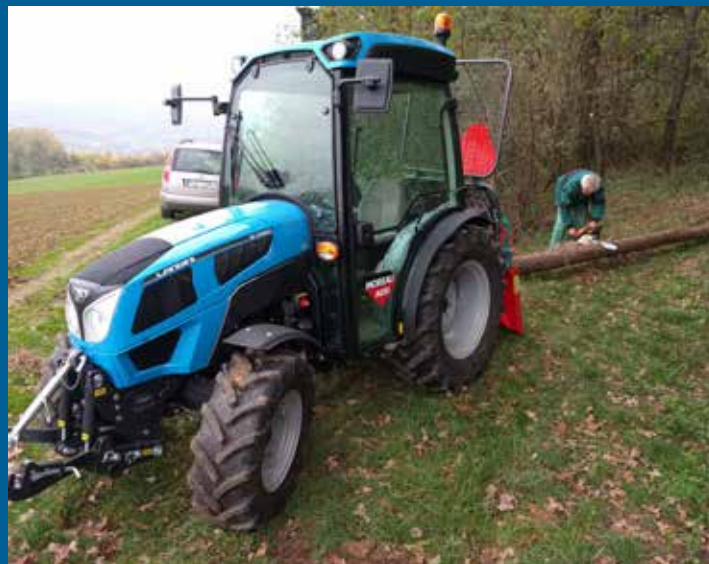
na akci Pořízení malotraktoru pro hospodaření v lesích městyse Polešovice získal městys dotaci z Programu rozvoje venkova 2014 – 2020 z programu Technika a technologie pro lesní hospodářství od Státního zemědělského intervenčního fondu